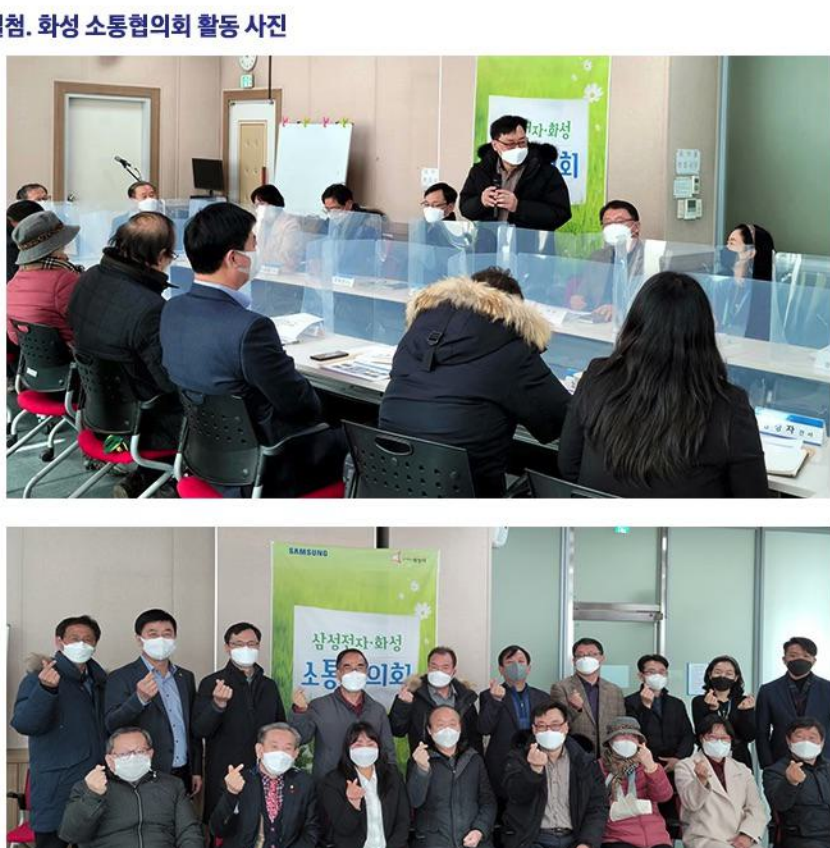
△ 정기회의 현장