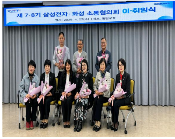
7기 화성소통협의회 지역위원