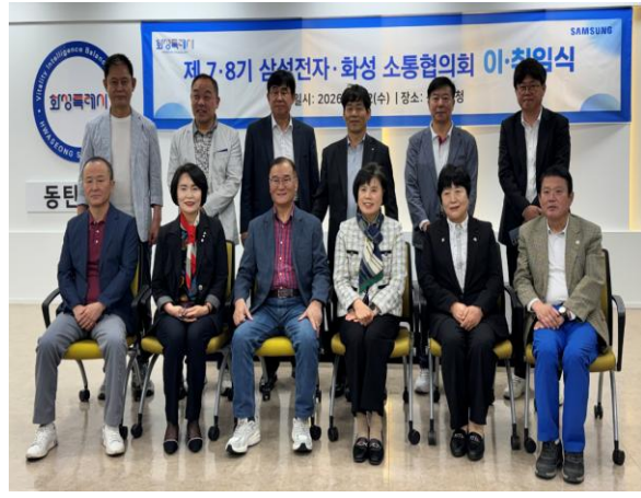
8기 화성소통협의회 지역위원