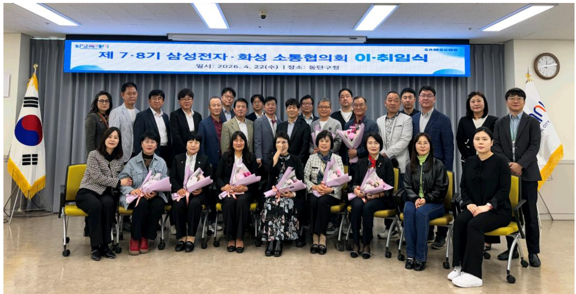
7/8기 화성소통협의회 이취임식(단체사진)