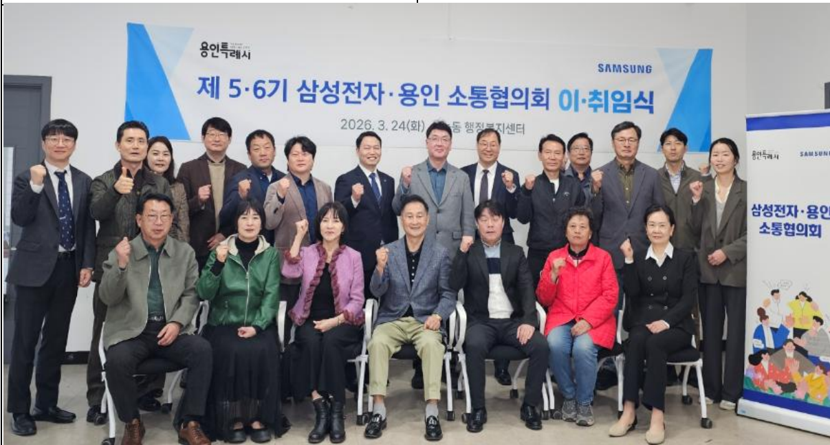
제 5기/6기 용인소통협의회 소통위원 이취임식